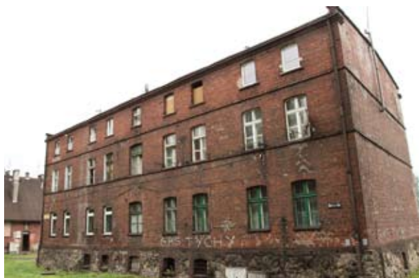
MZBM przygotowuje się do remontu bloków przy ul. Katowickiej