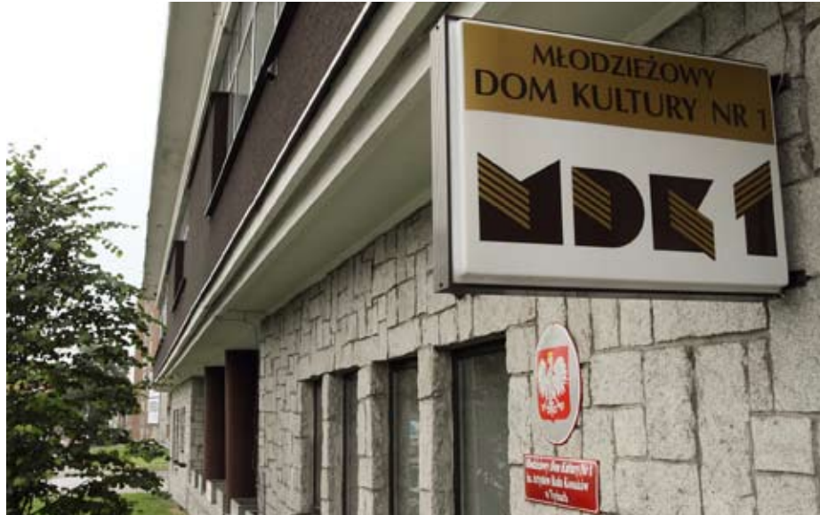
Więcej pieniędzy dostaną m.in. placówki kulturalne. W MDK nr 1 zamontowane zostaną klimatyzatory, wyremontowany będzie dach i podłogi.

Jedną z największych inwestycji, która zostanie zrealizowana dzięki zmianom w budżecie, jest budowa boiska sportowego u zbiegu ulic Łabędzi i Przepiórek, w dzielnicy Mąkołowiec.