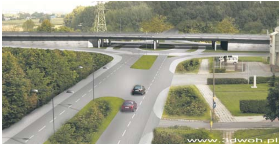
Skrzyżowanie alei Niepodległości z ul. Beskidzką zostanie przebudowane tak, by rozdzielić ruch lokalny od tranzytowego.