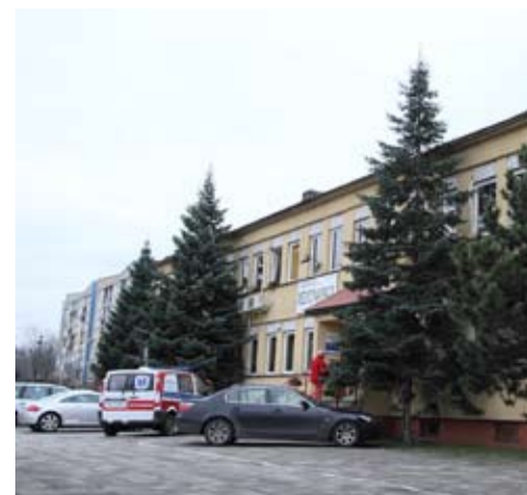
Zaszczepić można się m.in. w przychodni Hipokrates.