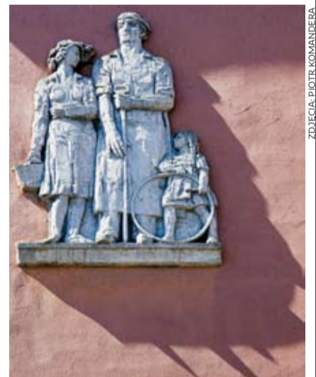
Płaskorzeźba na os. A.