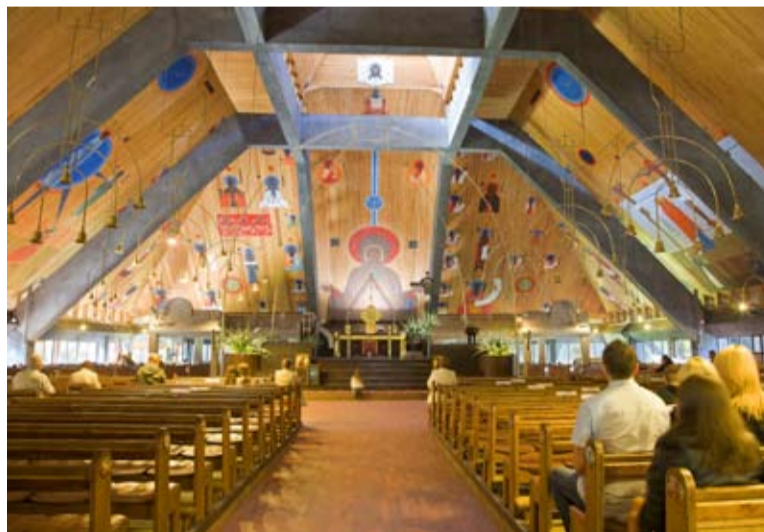
Kościół pw. Ducha Świętego z polichromiami autorstwa Jerzego Nowosielskiego.