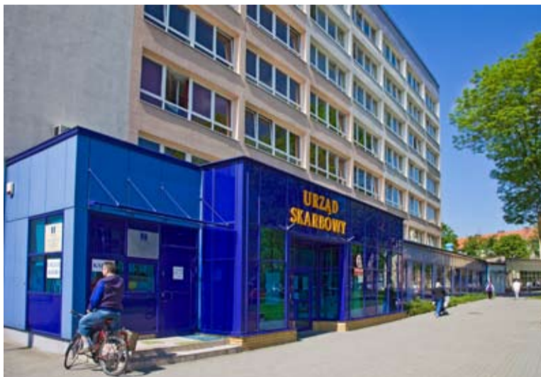
Dawny budynek Miastoprojektu – dziś mieści się tu Urząd Skarbowy.