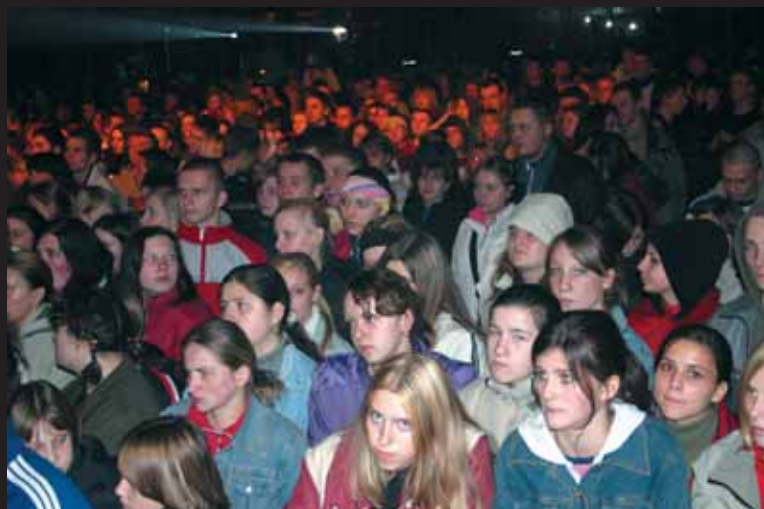
Tyska publiczność nie zawiodła - lodowisko pękało w szwach