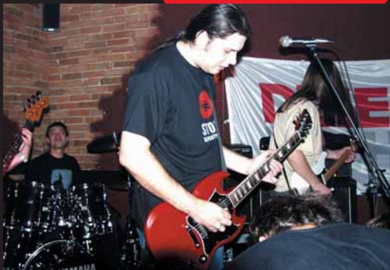
Koszulki z logo przypadły do gustu muzykom wspierającym akcję - koncert w pubie Scrubs