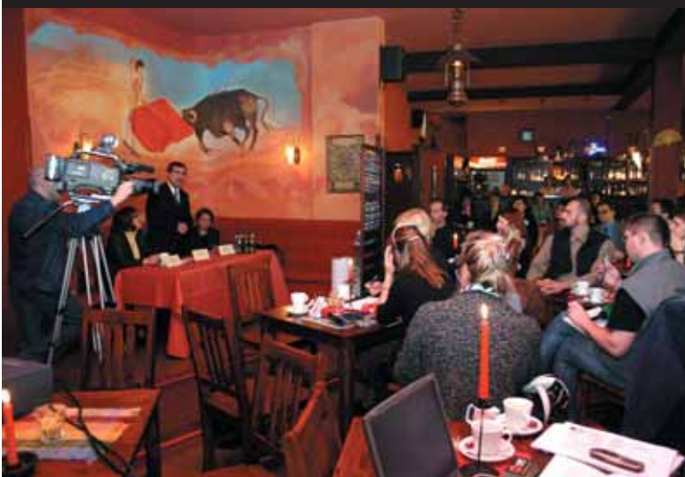
Kampanię „Stop narkotykom” rozpoczęła 25 października konferencja prasowa w pubie Corrida