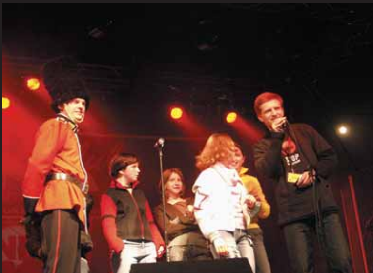
7 listopada, podczas finałowego koncertu na lodowisku w Tychach, nie zabrakło atrakcji dla publiczności