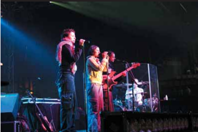
Występ gwiazdy wieczoru - zespół Sisters