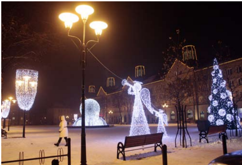
Na Placu Baczyńskiego pojawiły się nowe świecące anioły.

Szczegółowe informacje dotyczące konkursu dostępne są na stronie internetowej www.SwiecSie.pl oraz na www.facebook.com/swiecsie . Głosujmy na Tychy!