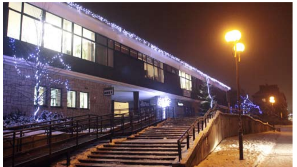
W tym roku został oświetlony także budynek Teatru Małego.