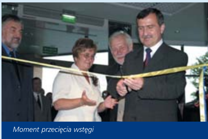
Moment przecięcia wstęgi

Obiekt dysponuje 80 lokalami użytkowymi. Według danych na 23 czerwca najemców znalazło już 59 z nich.