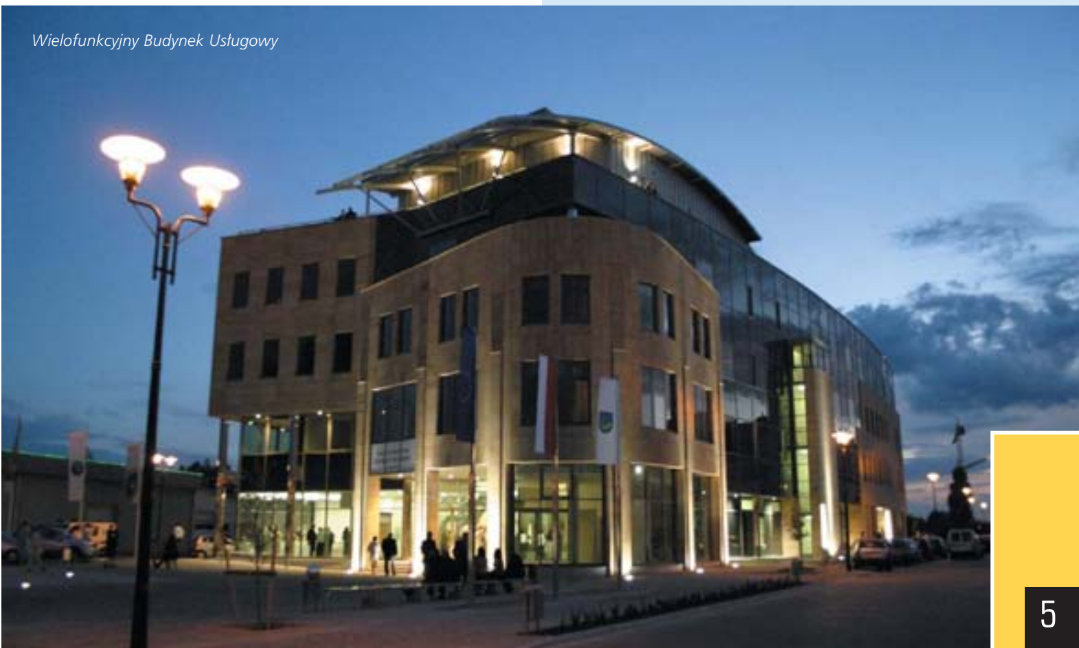
Wielofunkcyjny Budynek Usługowy