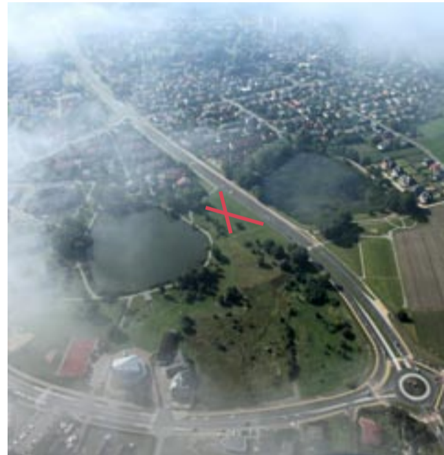
Psi park Suble.