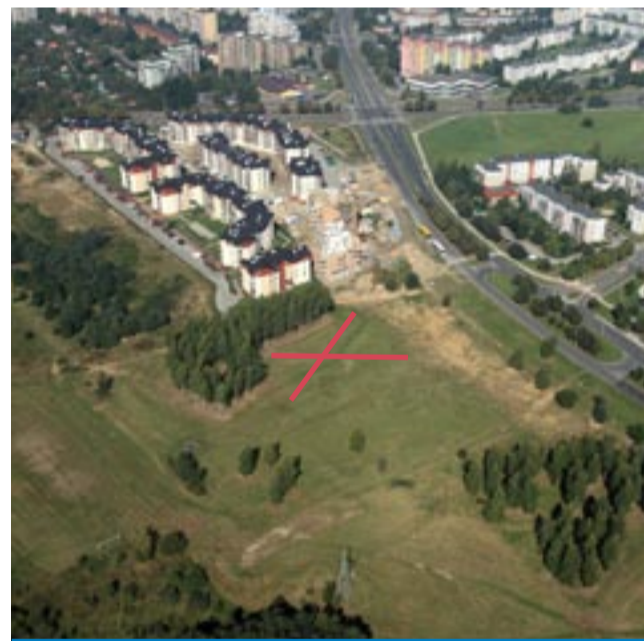
Psi park ul. Sikorskiego.