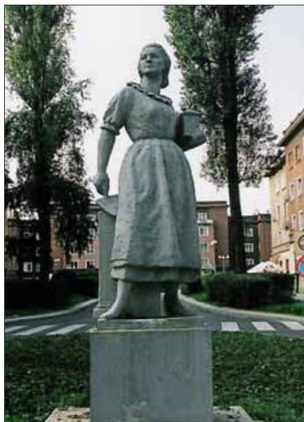
Posąg murarki przy wjeździe na plac św. Anny

Kiedy o planach rozbudowy Tychów do wielkości stutysięcznego miasta poinformowało radio, tyszenie przyjęli to z zaciekawieniem. Część z nich cieszyła się z przyszłego rozwoju miejscowości, inni byli pełni niepokoju i obaw. Większość jednak wyobrażała sobie, że pod budowę