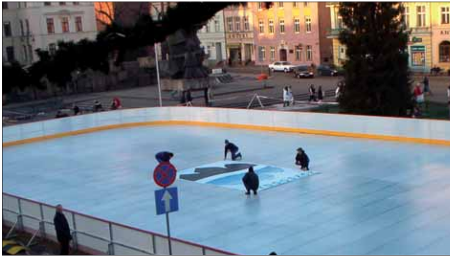
Tak będzie wyglądało nowe lodowisko

Już październiku lub listopadzie będzie można poślizgać się na odkrytym lodowisku, które zostanie ustawione na placu pod „Żyrafą”. Termin otwarcia obiektu zależy od pogody – tafelę można zmrozić, gdy temperatura w nocy spada poniżej zera, a w ciągu dnia nie przekracza 10 stopni.