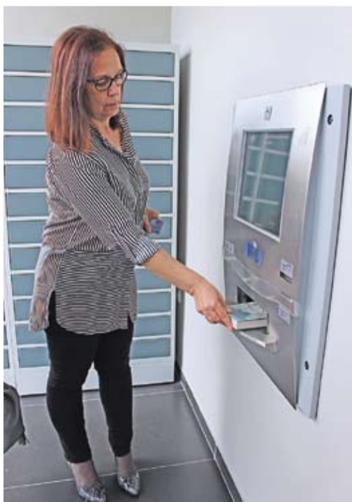
Wrzutnia umożliwia oddawanie książek do biblioteki przez całą dobę.