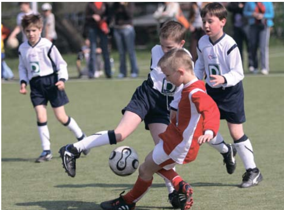
Piłkarska młodzież korzysta z ośrodka na osiedlu „A”, gdzie co weekend rozgrywany jest turniej Mini Mistrzostw Europy Deichmann 2008.