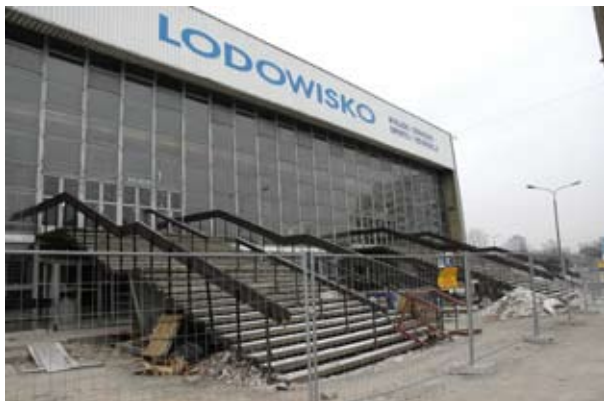
Lodowisko na początku prac remontowych...