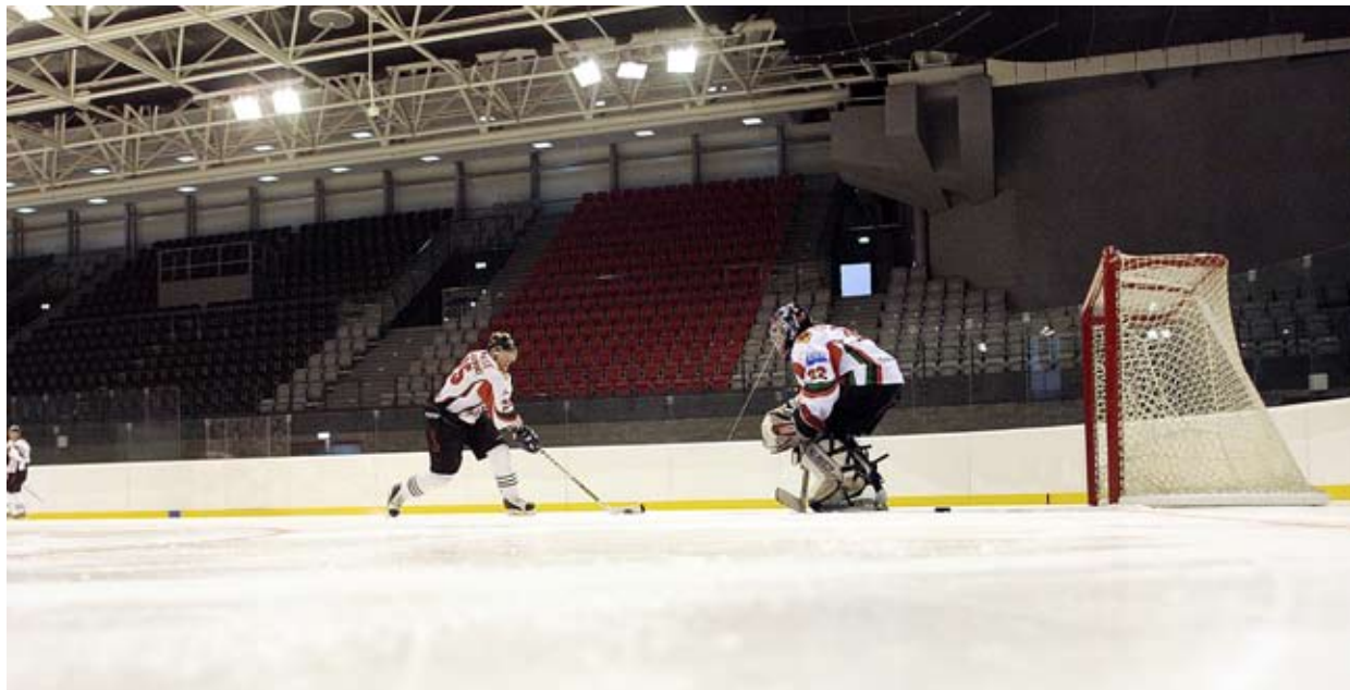
Na tyskim lodowisku trenują już hokeiści GKS Tychy. Pierwszy mecz rozegrają tu 16 stycznia.

Decyzję o modernizacji lodowiska przyspieszyła poważna awaria instalacji chłodzącej, a wyciek amoniaku przesądził o konieczności zastąpienia starych urządzeń nowymi. Prawie dwa lata temu, przed rozpoczęciem inwestycji rozważane były różne koncepcje remontu obiektu, w tym budowa nowego lodowiska. Jak się jednak szybko okazało, z punktu widzenia ekonomicznego, najwłaściwszy był wariant, który wybrano – czyli modernizacja hali lodowej. Zdaniem fachowców, przy wzroście cen materiałów i usług budowlanych, jakie nastąpiły, koszt budowy lodowiska wyniósłby około 70 mln zł. W ten sposób Tychy miałyby tylko jedno lodowisko, a tak, za jedną trzecią tej kwoty (minus dofinansowanie), zmoderni-