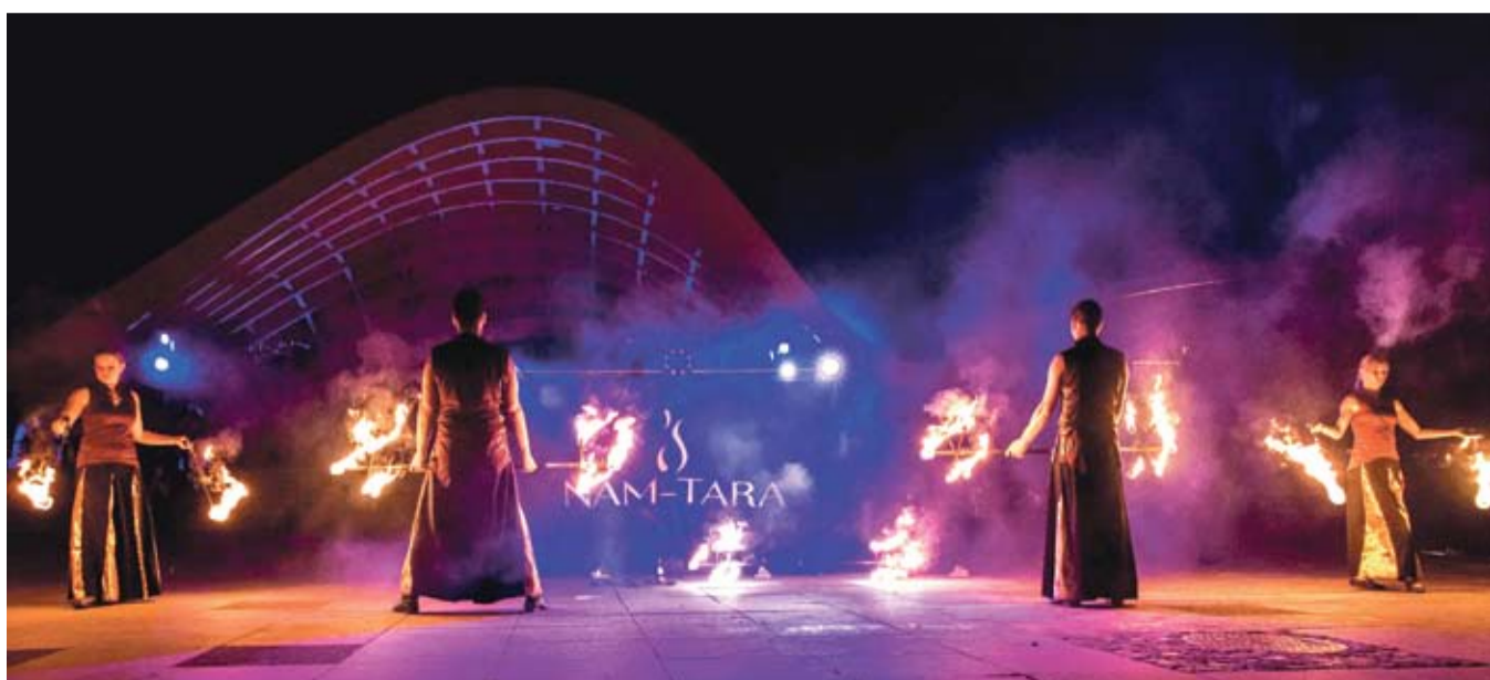
Ognioy pokaz grupy Nam-Tara z pewnością dostarczy widzom sporo emocji.