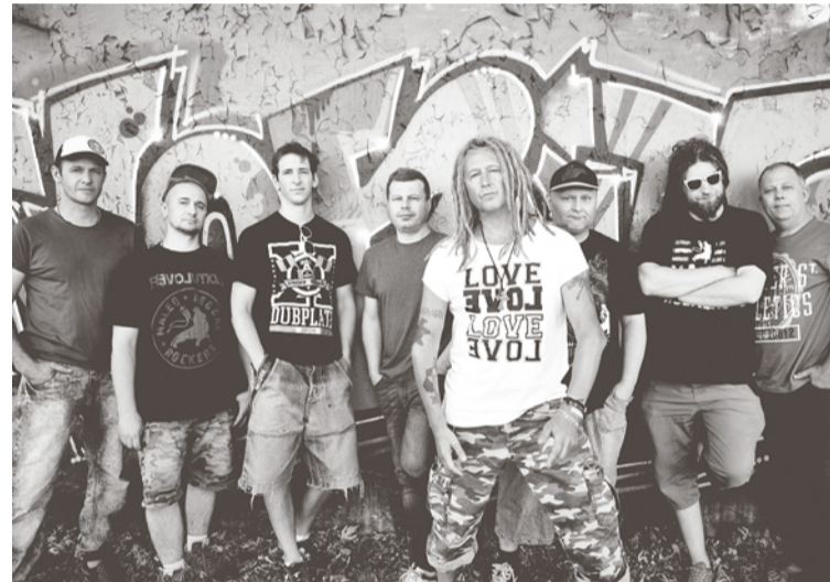
Zespół Maleo Reggae Rockers będzie gwiazdą pierwszego dnia Jarmarku.

W sobotę, 17 grudnia imprezę rozpoczyna „Śląskie Jasetka” w wykonaniu Teatru Trip. Później plac zamieni się w gigantyczną kuchnię. Będzie ogromna patelnia, w której kucharze będą przygotowywać